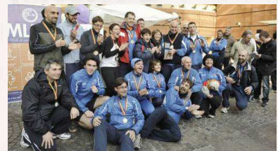
Alcuni momenti della "Relay Lodi Marathon", con la partenza dal Bipielle Center e i passaggi sulla scalinata Federico II, sul ponte e sui passaggi